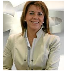
María Dolores de Cospedal Secretaria General PARTIDO POPULAR