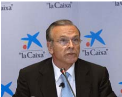
Isidro Fainé Presidente CECA – LA CAIXA