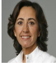
Rosa Aguilar Ministra MEDIO AMBIENTE, MEDIO RURAL Y MARINO