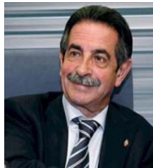
Miguel Ángel Revilla Presidente G. de CANTABRIA