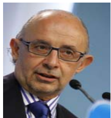
Cristóbal Montoro Coordinador Economía PARTIDO POPULAR