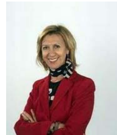
Rosa Díez Secretaria General UNIÓN, PROGRESO Y DEMOCRACIA