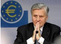
Jean Claude Trichet Presidente del Banco Central Europeo