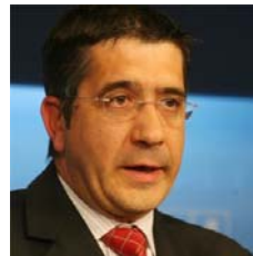
Patxi López Lehendakari PAIS VASCO