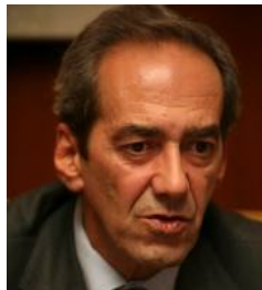
José M. Gzlez.-Páramo Miembro Comité Ejecutivo BCE