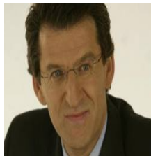
Alberto Núñez Feijoo Presidente XUNTA DE GALICIA