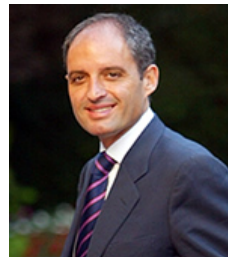
Francisco Camps Presidente de la GENERALITAT VALENCIANA